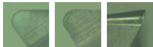
Fluide de coupe concurrent (Courbe rouge)