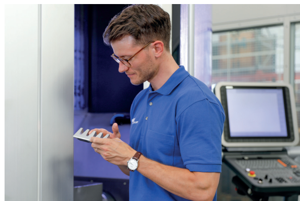
Emulsione stabile e pezzi puliti