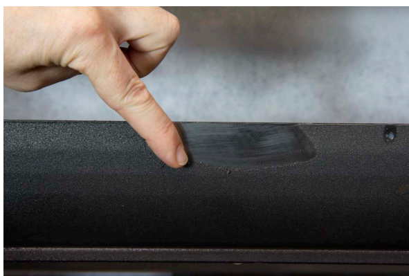
Pulizia facile di macchine e pezzi lavorati