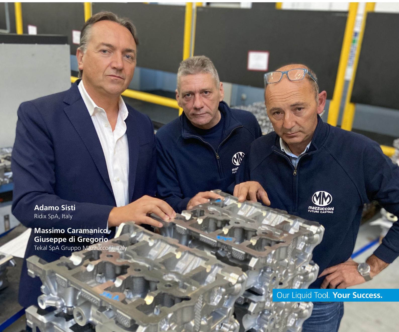
Adamo Sisti Ridix SpA, Italy