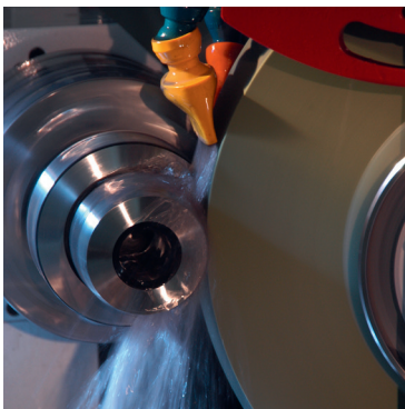
外圓研磨 (圖為 Studer 機台)