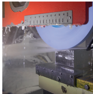
Rettifica di superfici (immagine: macchina Blohm)