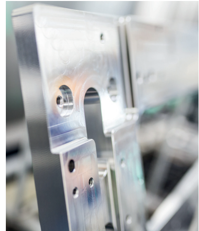
정밀 세척에 적합