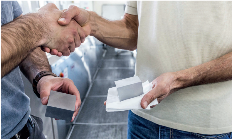
깨끗한 표면: 일반적인 절삭유 (왼쪽) Synergy 735 (오른쪽)